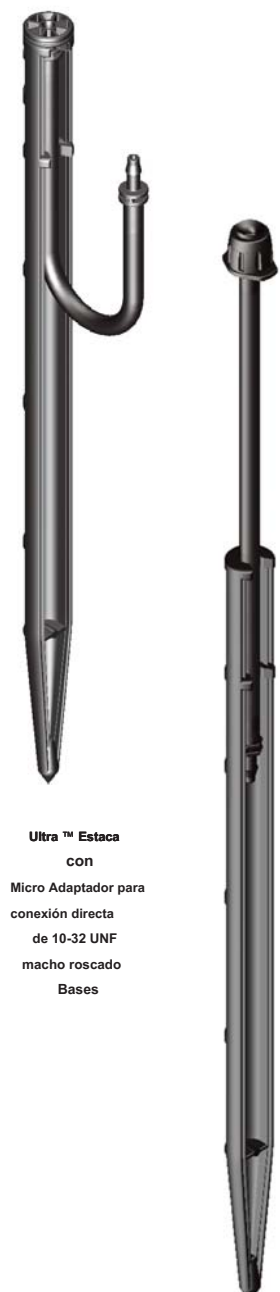
Ultra™ Estaca con Micro Adaptador para conexión directa de 10-32 UNF macho roscado Bases