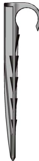
Gancho de tierra