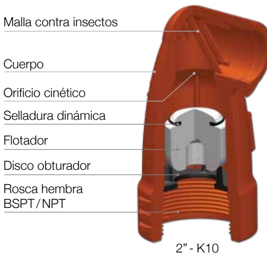
2" - K10