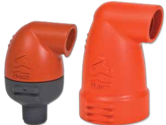
3/4", 1" - K10

Gracias a su diseño aerodinámico de avanzada y el orificio cinético, esta válvula proporciona una excelente protección contra la formación de vacío, con cierre hermético mejorado al funcionar con presiones bajas.